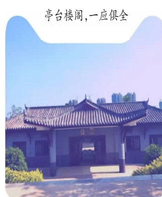
亭台楼阁,一应俱全

“这厕所修得好有创意哦!有的修成莲藕造型,有的四周装饰了巨大的荷叶、荷花……”近日前往开江县莲花世界游玩的游客无不感叹,独具匠心的造型让景区公厕华丽逆袭变成了“景点”。