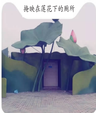
掩映在莲花下的厕所