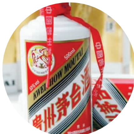
超市竟销售假茅台