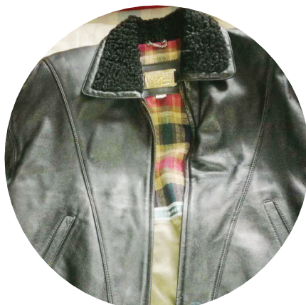
名牌皮衣被干洗店洗缩水