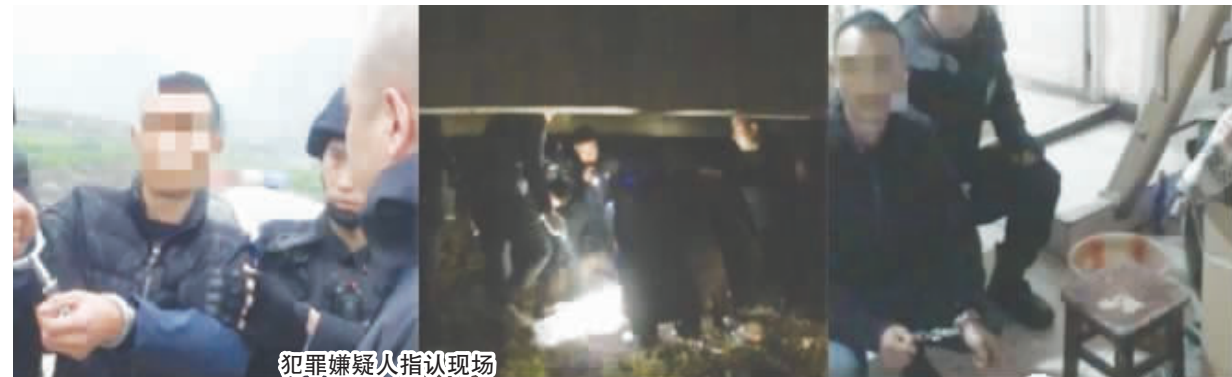
犯罪嫌疑人指认现场