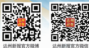
达州新报官方微博