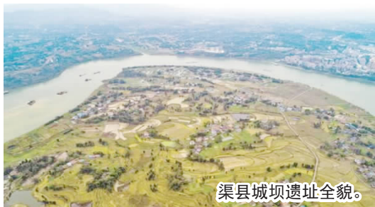
渠县城坝遗址全貌。

1999年、2003年、2007年、2016年、2019年和2020年,四川省文物考古研究院、达州市文物管理