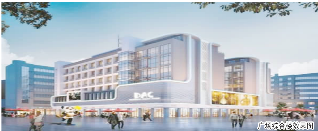
广场综合楼效果图

为推进文明城市创建,进一步提升城市形象,达州火车站及周边环境整治改造工作日前正式启动。