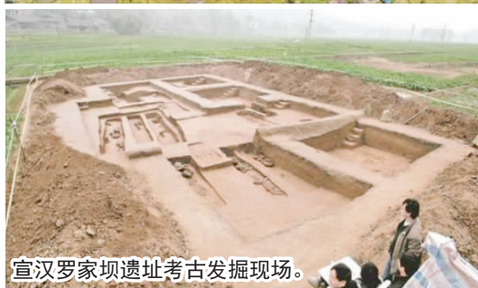
宣汉罗家坝遗址考古发掘现场。

所和宣汉县文物管理所先后联合对罗家坝遗址实施了六次考古发掘(第六次发掘目前正在进行中),截至目前,揭土面积2000余平方米,出土青铜器、陶器等各类器物1600余件。尤其是M33号大墓出土的青铜礼器、兵器、彩绘陶器和印章等珍贵文物200多件,名震海内外文物界。